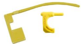
Indicadores de Recámara Vacía